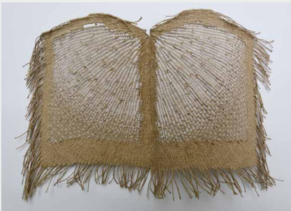
Włodzimierz Cygan – Polska Dzień, 2002 technika: tkanie Grand Prix 2. MBATL 2002